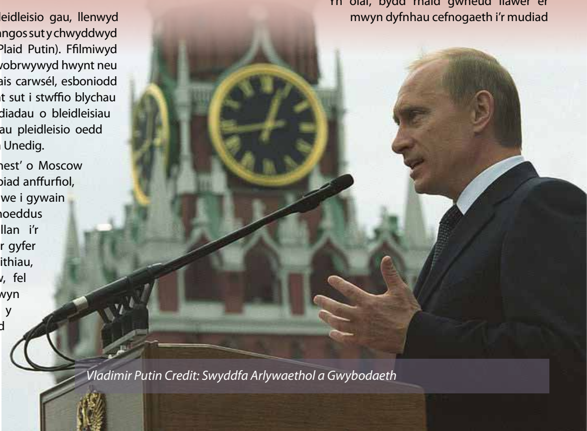
Vladimir Putin

Yn olaf, bydd rhaid gwneud llawer er mwyn dyfnhau cefnogaeth i'r mudiad