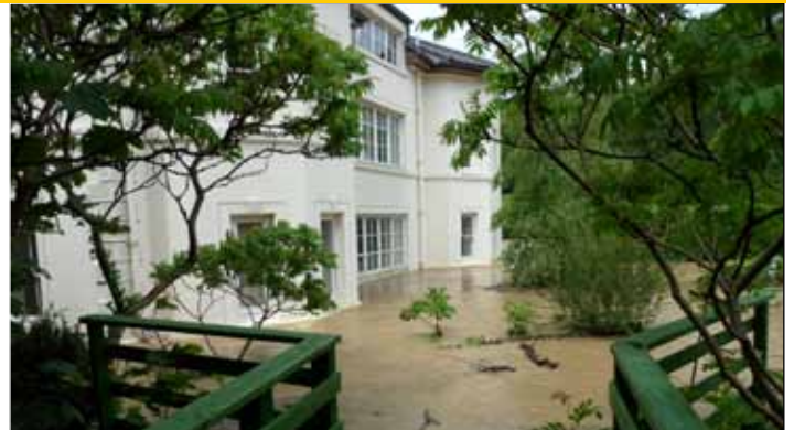
Dŵr i fyny at y ffenestri ym Mhlas Gogerddan

Roedd dŵr ar rai o'r prif ffyrdd i mewn i Aberystwyth hefyd yn achos pryder i fyfyrwyr oedd yn paratoi i adael y Brifysgol ar ddiwedd tymor yr haf.