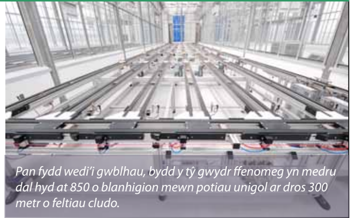
Pan fydd wedi'i gwblhau, bydd y tŷ gwyrdd ffenomeg yn medru dal hyd at 850 o blanhigion mewn potiau unigol ar dros 300 metr o feltiau cludo.

Mae'r buddsoddiad o £5.6m, mewn cyfleusterau ar Benglais yn cynnwys labordai