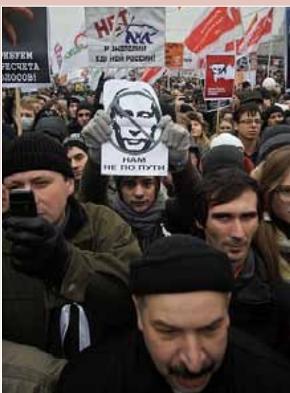
Protest mis Rhagfyr

Bu cannoedd o ymgeiswyr o'r gwrthbleidiau yn llwyddiannus mewn etholiadau trefol diweddar, gan ennill seddi ar gynghorau lleol a'r faeryddiaeth mewn dinasoedd o faint sylweddol fel Tolyatti a Yaroslavl. Ceir, yn yr etholiadau lleol a rhanbarthol a gynhelir ym mis Hydref, gyfle arall iddynt ennill hygrdedd ger bron y pleidleiswyr, a datblygu'n bŵer sylweddol mewn gwleidyddiaeth Rwsiaidd.