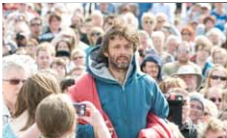
Michael Sheen yng nghynhyrchiad Theatr Genedlaethol Cymru, 'The Passion in Port Talbot'

www.aber.ac.uk/cy/graduation/order-ceremonies