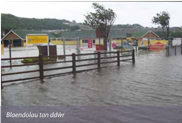
Blaendolau tan ddŵr

Fis yn ddiweddarach a phrin yw'r arwyddion sydd ar ôl o'r llifogydd a ddenodd sylw'r byd. Fodd bynnag, tu hwnt i lygaid y cyhoedd, parhau mae'r glanhau, fel y gwna'r gwaith o weithio gyda'r cwmnïau yswriant.