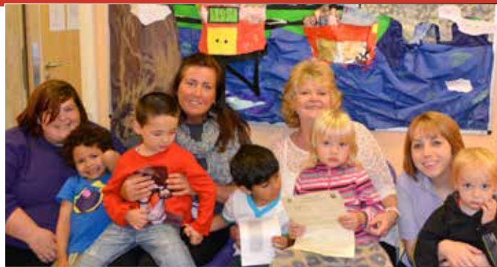
Mae staff a phlant ym Meithrinfa Penglais

Nododd yr arolwg bod "y plant yn teimlo'n hapus a diogel yn y feithrinfa" a'u bod yn "cyflawni'n dda ac yn gwneud cynnydd da o'u man cychwyn". Dywedwyd bod safon yr addysgu'n 'gyson dda' a bod "yr ystod eang o brofiadau diddorol a gweithredol yn sicrhau bod plant yn mwynhau ac yn ymgymryd â'u dysgu gyda brwdfrydedd".