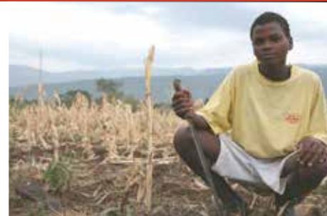
Newyn yn Ethiopia

Y stori'n llawn: www.aber.ac.uk/cy/news/archive/2013/09/title-140354-cy.html