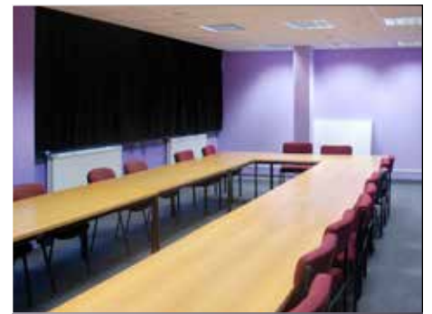
Ystafell ddyysgu adnewyddu, Adeilad Hugh Owen

Fe ddechreuwyd gyda dau brosiect yr haf hwn. Yn gyntaf, gan ddilyn c y f a r w y d d y d ein harbenigwyr preswyl ar fannau dysgu a thechnoleg dysgu, adnewyddwyd holl brif ystafelloedd dysgu Adeilad Hugh Owen. Bellach ceir ynddynt offer