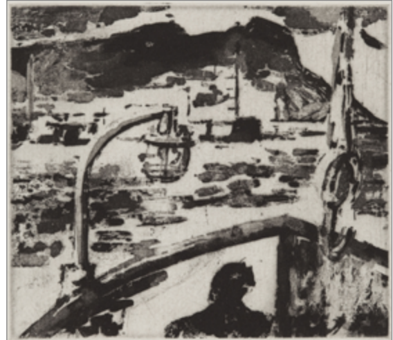
The Open Sea, ysgythriad, o If This is a Man gan Primo Levi, Cymdeithas Folio, 2000

Printiadau a chasgliad personol yr artist o gelfyddyd gain ac addurnol.