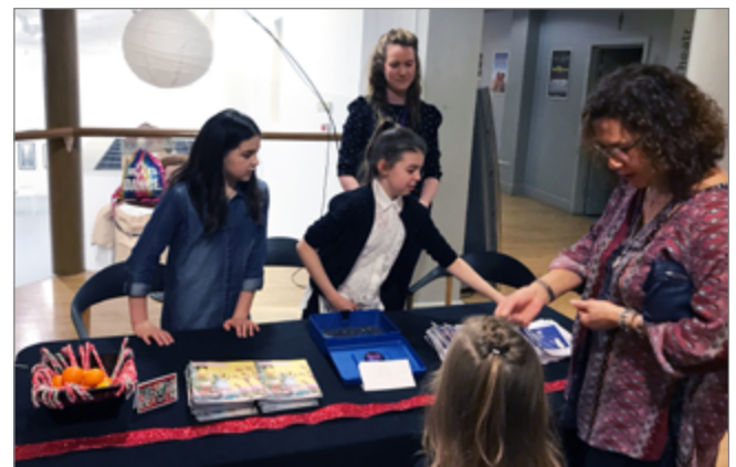
Aelodau o Fforwm Ieuenctid Penparcau yn helpu gyda'r dyletswyddau blaen tŷ yn ystod perfformiadau o The Little Match Girl yng Nghanolfan y Celfyddydau Aberystwyth, Rhagfyr 2017.

Os ydych chi'n byw ym Mhenparcau, neu os oes gennych ffrindiau neu deulu sy'n byw yno, rydyn ni'n awyddus iawn i gael rhagor o drigolion i fod yn rhan o'r prosiect gwych hwn. Mae'n agored i holl grwpiau a thrigolion Penparcau. I gael rhagor o wybodaeth ynglŷn â chymryd rhan cysylltwch ag Alaw Griffiths yng Nghanolfan y Celfyddydau, alg54@aber.ac.uk / 01970 622832.