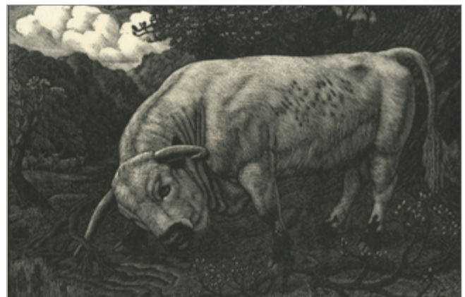
The Chartley Bull, engrafiad pren, 1939