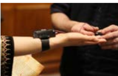
Ffitio'r dyfeisiau mesur biometrig

Bydd Y Fortecs yn ymddangos nesaf yng ngŵyl Steampunk Spectacular Aberystwyth ar 13-14 Hydref 2018.